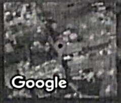
Dhamtari, Chhattisgarh, India B-23, Near Government Pg College, Panchvati Colony, Dhamtari, Chhattisgarh 493773, India Lat 20.712423° Long 81.527674° 25/04/25 09:15 AM GMT +05:30