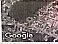
Ratnabandha, Chhattisgarh, India Durg Rd, Panchvati Colony, Ratnabandha, Chhattisgarh 493773, India Lat 20.71741° Long 81.528872° 25/04/25 09:51 AM GMT +05:30